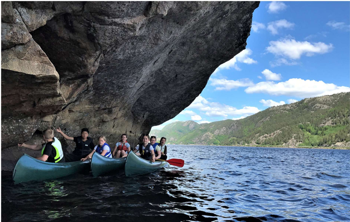
Elevar på kanotur ved Skipheddaren.

Åseral skal vera ein attraktiv kommune for fastbuande og tilreisande. Kommunen har i overkant av 900 innbyggjarar og om lag 2500 fritidsbustader. Desse er i hovudsak knytt til utbyggingsområda i Eikerapen, Ljosland og Bortelid. Tilrettelegging for kommunen sine innbyggjarar og tilreisande må ein sjå i ein samanheng. Det må vere eit mål for anleggsutbygginga å ha rekreasjonsområde og anlegg tilrettelagt for eit mangfald av aktivitetar heile året og for ulike aldersgrupper.