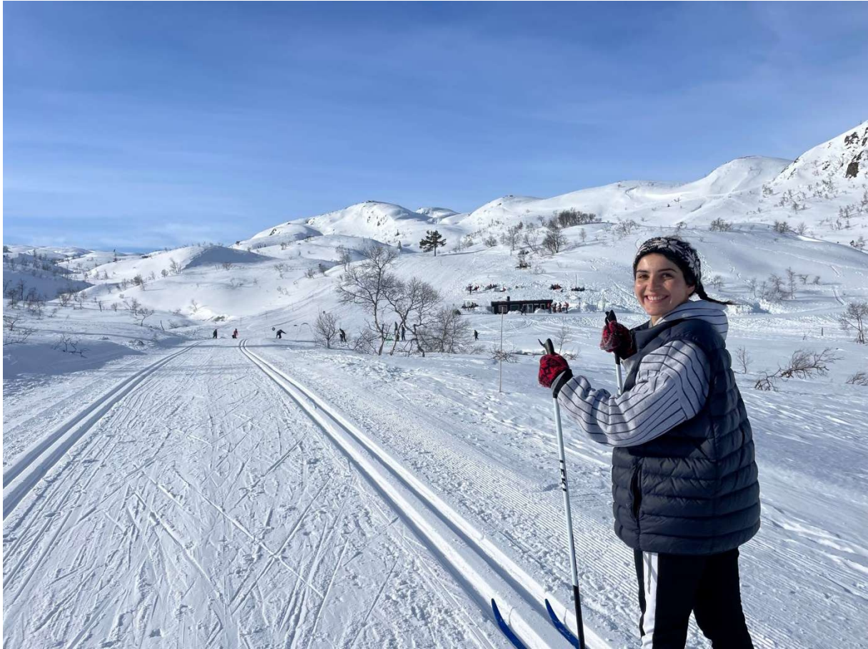
På tur til dagsturhytta og skileikanlegget ved Farevatn, Ljosland.

Andre aktivitetsanlegg og turmål i området er skileikanlegg og dagsturhytte i vestenden av Farevatn. Rundt Grønli tjønn er det tilrettelagt ei rundløype med asfaltdekke. Om lag 1,5 km vest for Grønli tjønn og ved Upsetjønn ligg det også dagsturhytter.